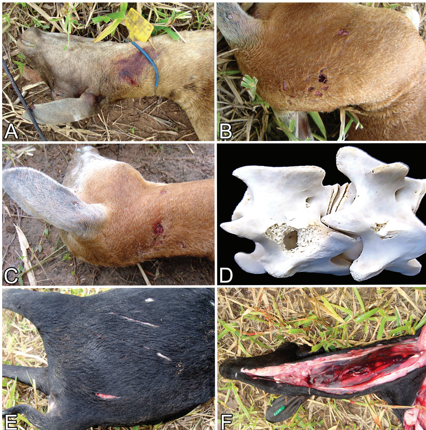
Fig.2. Lesões em ovinos atacado por Puma concolor no estado de Mato Grosso, Brasil, em fevereiro de 2010. (A-C) Feridas perfurantes na região cervical atlanto-axial dorsal. (D) Perfuração de vértebras cervicais. (E) Feridas perfurantes na região cervical atlanto-axial dorsolateral e hemorragia. (F) Músculos cervicais com sufusão da região submandibular à região cervical profunda.

Outros casos de depredação, dos quais não foi possível serem realizadas necropsias, o diagnóstico foi baseado nos sinais característicos deixados nas presas (Hoogesteijn et al. 1993). Os diagnósticos realizados nesta mesma propriedade entre 2005 e 2014 estão apresentados no Quadro 1 e os casos de depredação representaram 46% das mortes no período estudado. As principais doenças diagnosticadas nesta propriedade foram a calcinose enzoótica (Guedes et al. 2011) e a pitiose rinofacial (Ubiali et al. 2013).