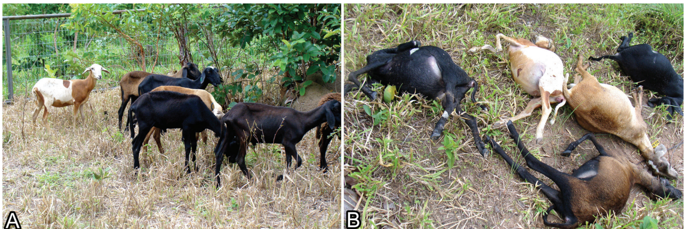
Fig.1. (A) Ovinos mantidos em recinto antes do ataque de Puma concolor , janeiro de 2010. (B) Carcaças de cinco ovelhas após ataque depredatório de Puma concolor a ovinos. Alto Paraguai, MT, fevereiro de 2010.

No dia seguinte a onça-parda retornou ao local da carcaça e foi abatida por caçadores contratados para tal fim. Os autores são expressamente contrários ao abate de carnívoros silvestres e somente reportam o fato, afim de manter a descrição dos eventos de maneira imparcial. A Lei nº 5.197, de 3 de janeiro de 1967 dispõe sobre a proteção à fauna e dá outras providências. O Artigo 1º protege a fauna silvestre, sendo proibida a sua utilização, perseguição, destruição, caça ou apanha (Brasil 1967).