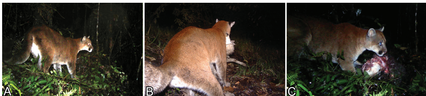
Fig.4. Ataque depredatório de onça-parda a ovinos registrado com armadilhas fotográficas pela equipe da Panthera Colômbia nos Andes Colombianos, em 3.000m de altitude. (A) Onça-parda se deslocando em direção ao cercado dos carneiros. (B) Onça-parda com uma ovelha mordida na garganta. (C) A onça-parda regressou ao local do ataque depredatório para consumir a carcaça da ovelha.